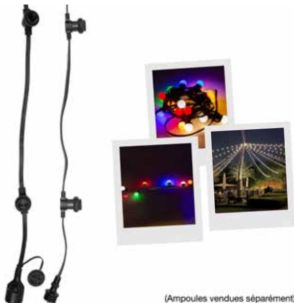
(Ampoules vendues séparément)