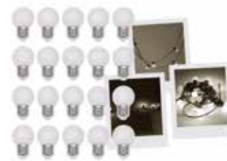
(Guirlande vendue séparément)

Pack de 20 ampoules 1.5W de 6 couleurs. Soquet E27 Réf. 75279-0661 - 24.90€ TTC