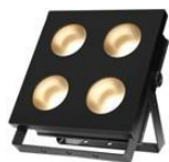
JNR-8146A BLINDER 4x100 C/W

BLINDER 4x100 - 4x100W (5600K/blanco puro - 3200K/blanco cálido) COB LEDs - Control individual para cada led COB - Control: DMX512 - Esclavo-maestro y activación por sonido o automático - Ángulo de luz: 100° - Canales: 4/8 - Consumo: 330W (8146C) /340W (8146W) - CRI: Ra≥90 (JNR-8146W) - Dimensiones: 408 x 153 x 411mm - Peso: 5,92Kg - IP20.