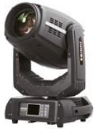
JNR-8152A BWS 350

BWS350 - 1 Lámpara 17R YODN de 350W - Control: DMX512 - Esclavo-maestro y activación por sonido o automático - Rueda fija con 14 gobos y 9 rotatorios - Rueda de 13 colores - Prisma circular de 8 caras - Canales: 24/16 - DMX-512 - Consumo: 500W - Dimensiones: 465 x 260 x 600mm - Peso: 19Kg.