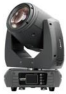
JNR-8130 MINI BEAM 280

MINIBEAM 280 - 1 Lámpara 10R OSRAM de 280W - Control: DMX512 - Esclavo-maestro y activación por sonido o automático - Canales: 14/16 - Rueda gobo estática con 16 gobos - Prisma rotatorio doble rueda - 16 caras + 8 caras combinables - 1 rueda de color con 11 colores - Consumo: 330W - Dimensiones: 298 x 199 x 434mm - Peso: 13,16Kg.