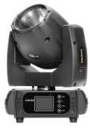
JNR-8108 150L BEAM

LED MINIBEAM 150 - 1 Led 150W blanco 7500K - Control: DMX512 - Esclavo-maestro y activación por sonido o automático - Canales: 13/11/15 - Rueda con 17 gobos estáticos y 14 colores - Consumo: 170W - Dimensiones: 183 x 298 x 417mm - Peso: 11Kg.