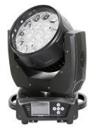
JNR-8153 150L WASH

LED MINIWASH 150 - 1 Led COB de 150W RGBW (4 in 1) + CMY - Control: DMX512 - Esclavo maestro y activación por sonido o automático - Canales: 10/12 - Consumo: 175W - Dimensiones: 260 x 150 x 348mm - Peso: 5,6Kg