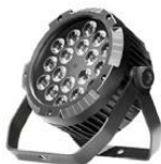
JNR-8160A FLAT PAR

FLAT PAR LED - 18x 18W LEDs (RGBAW+UV, 6 en 1) - Control: DMX512 - Esclavo-maestro y activación por sonido o automático - Ángulo de luz: 25° - Canales: 6/10 - Consumo: 75W - Dimensiones: 210 x 210 x 120mm - Peso: 4Kg - IP20.