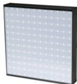
JNR-8157 PIXEL PANEL 144

PÍXEL PANEL 144 - 144 LEDs SMD5050 (RGB, 3 en 1) - Control: DMX512 - Esclavo-maestro y activación por sonido o automático - Canales: 8/35/432 - Consumo: 51W - Dimensiones: 300 x 300 x 118mm - Peso: 2,3Kg.