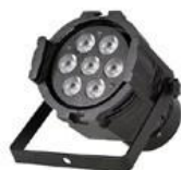
JNR-8161E FLAT PAR

FLAT PAR LED - 12x 8W LEDs (RGBW, 4 en 1) - Control: DMX512 - Esclavo-maestro y activación por sonido o automático - Angulo de luz: 25° - Canales: 6/10 - Consumo: 100W - Dimensiones: 210 x 210 x 120mm - Peso: 2,5Kg - IP65.