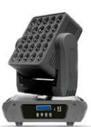
JNR-8094 MATRIX 2510

MATRIX 2510 - 25 Led 10W (RGBW 4 en 1) controlables individualmente. Control: DMX512 - Esclavo - maestro y activación por sonido o automático - Efecto de BEAM y Wash - Canales: 23/33/121 - Consumo: 300W - Dimensiones: 290 x 380 x 490mm - Peso: 14,92Kg.