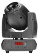
JNR-8124 90L BEAM

LED MINIBEAM 90 - 1 Led 90W blanco - Control: DMX512 - Esclavo maestro y activación por sonido o automático - Canales: 10/12 - Rueda con 17 gobos estáticos y 14 colores - Consumo: 135W - Dimensiones: 149 x 270 x 364mm - Peso: 5,8Kg.