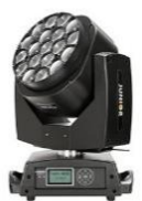
JNR-8119A/B MANTIS 1915

MANTIS 1915 - JNR 8119A: 19x 20W OSRAM LEDs (RGBW 4 en 1) / JNR 8119B: 19x 15W Chinese LEDs (RGBW 4 en 1) - Control: Art-Net, King-Net, estándar DMX512 - Esclavo-maestro y activación por sonido o automático - Ángulo de luz: 4°~60° - Canales: 21/35/78/92/97 - Consumo: 500W - Dimensiones: 358 x 253 x 494mm - Peso: 15,42Kg - IP20.